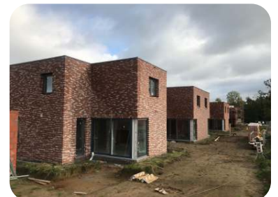
Foto's hierboven - nieuwbouw Halleweg te Roosdaal verwacht in de zomer 2021