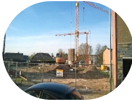
Opwijk, Smidseweg 16 huurwoningen