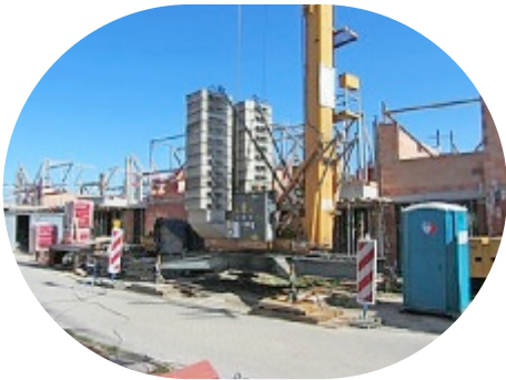
Liedekerke, Heidestraat 16 koopwoningen