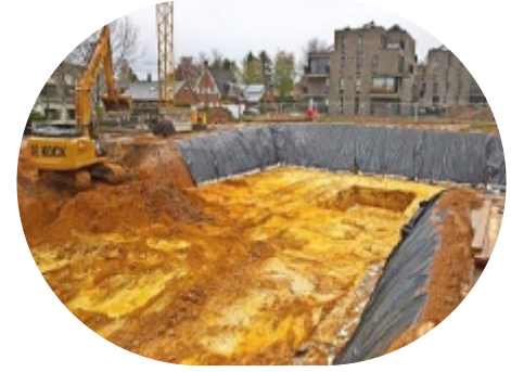
Overijse, Drogenberg 28 huurappartementen