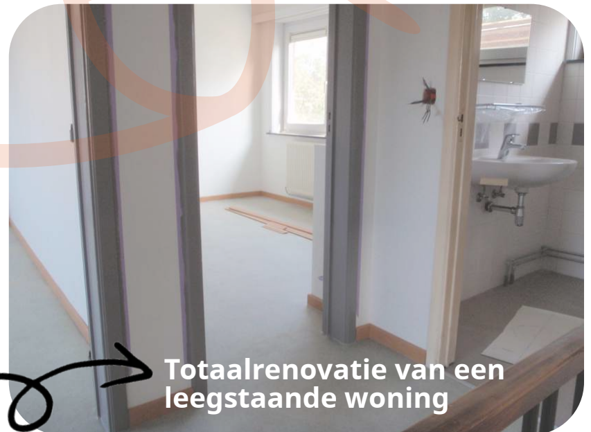
Totaalrenovatie van een leegstaande woning

Van zodra Providentia dan een aanvraag tot maandelijks afbetaling via MyTrustO ontvangt, zullen wij onze medewerking hieraan verlenen.