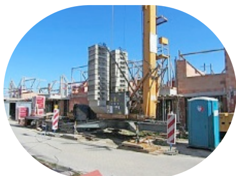
Liedekerke, Heidestraat 16 koopwoningen

DILBEEK Eekhoortjeserf, Hermelijnlaan en Tuinslaper 22 huurwoonegelegenheden Vermoedelijk 1ste verhuring eind 2016