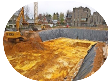
Overijse, Drogenberg 28 huurappartementen