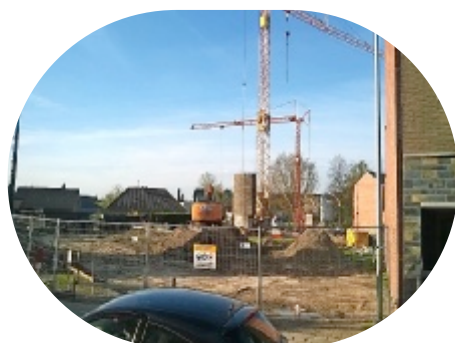
Opwijk, Smidseweg 16 huurwoningen